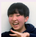
めいさん 市立浦和中合格